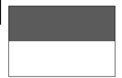
インドネシア共和国