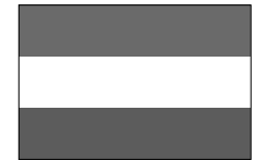
シエラレオネ共和国