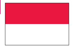
インドネシア共和国