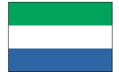
シエラレオネ共和国