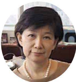
中満 泉 国連軍縮問題担当上級代表

ことしの世界大会には、国連・核兵器禁止条約交渉会議で交渉をリードした国連、政府代表が参加します。禁止条約が採択された下で、新しい情勢や展望を学べるのはここだけです。