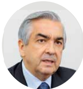
カルロス・アルマダー 駐日メキシコ大使