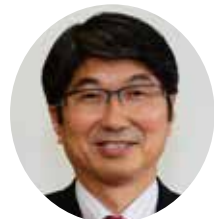
あいさつ 田上富久 (長崎市長)

オープニング(うたごえ)／開会あいさつ／メッセージ紹介／主催者報告／長崎市長あいさつ／被爆者あいさつ／国連、政府代表発言／核兵器のない世界に向けて行動を、「ヒバクシャ国際署名」の国民的発展めざして／オール沖縄のたたかいに連帯／2017年国民平和大道進全国通し行進者・国際青年リレー行進者