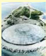
放射性物質を廃棄してアタをした、エニウェトク環礁のルニットドーム