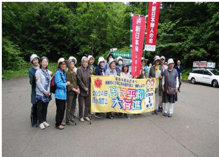
△青森・秋田の新婦人の皆さん