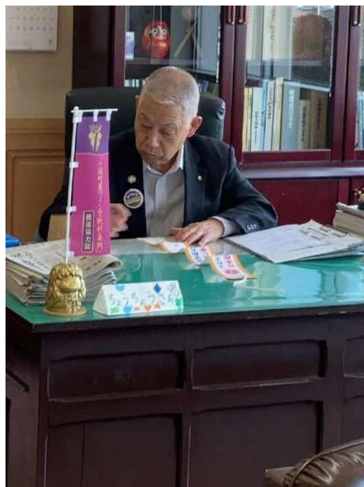
△ペナントに記名する小坂町細越町長