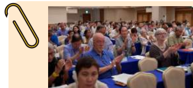
国際会議宣言を拍手で採択

広島、長崎の被爆者のメッセージ、核実験被害者の証言、科学者・研究者からの発言、内外の専門家が提言します。核兵器の非人道性を告発し、「核抑止力」論の誤りを明らかにし、核兵器禁止条約の促進、「核兵器のない世界」のための共同行動について討論します。